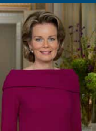
SOS Villages d'Enfants Belgique ASBL 'Sous le Haut Patronage de Sa Majesté la Reine'