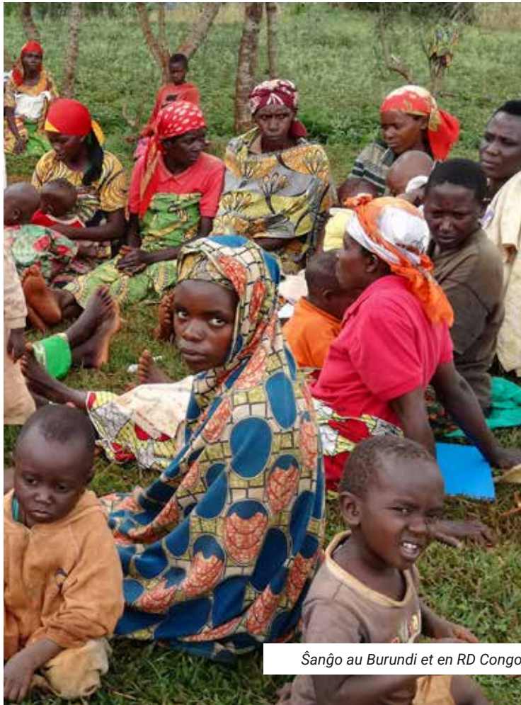
Sanjo au Burundi et en RD Congo