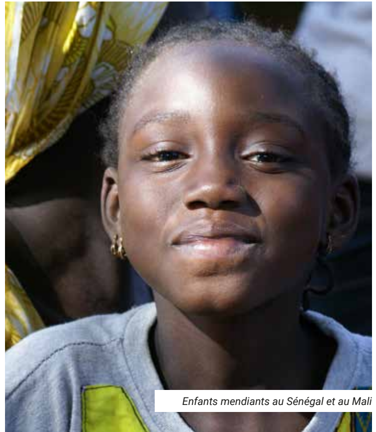
Enfants mendiants au Sénégal et au Mali

SOS Villages d'Enfants Belgique soutient ces projets en collaboration avec les partenaires suivants. Pour découvrir tous les projets organisés par SOS Villages d'Enfants International, surfez sur sos-childrensvillages.org .