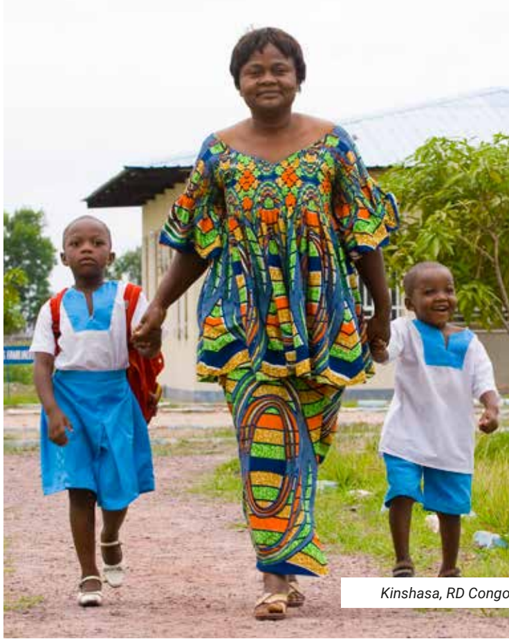
Kinshasa, RD Congo